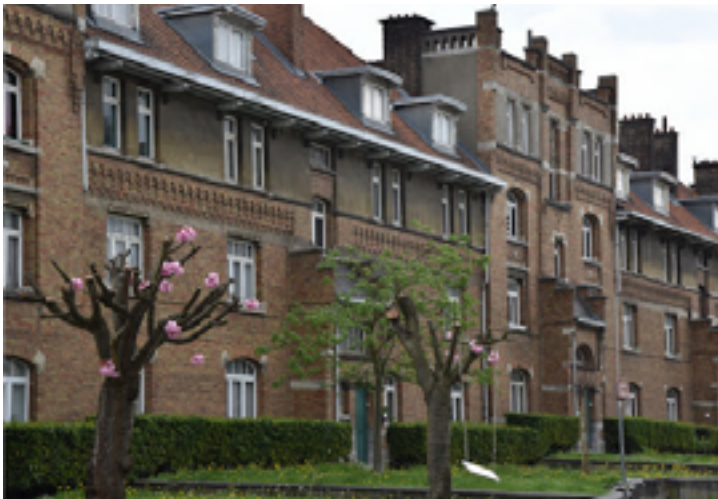
La cité Volta