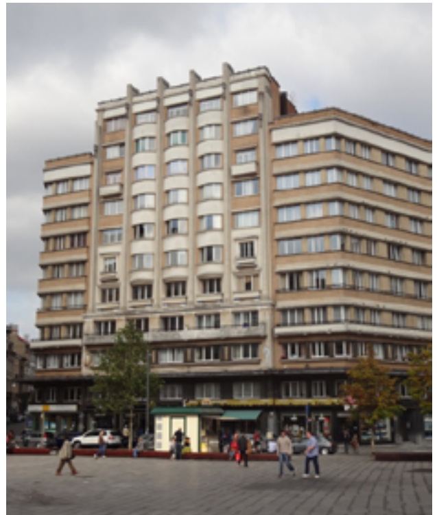
The Victory House