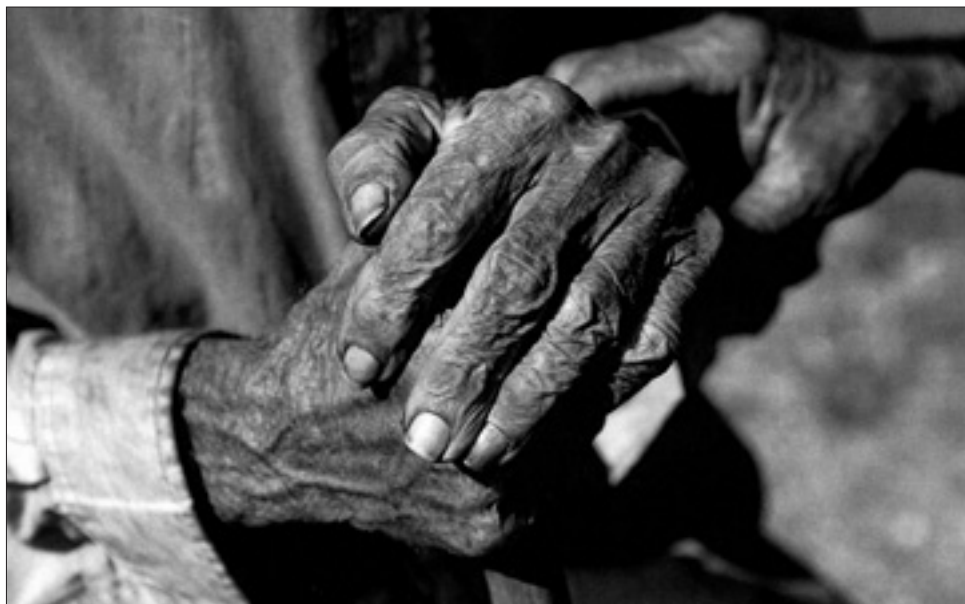
Exposition "Cubanidades"