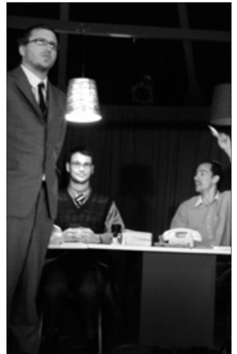
"Le Canard bleu" - La soupape