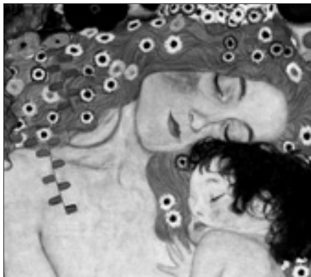
Oeuvre de Gustave Klimt (détail)

NL/ Een technisch probleem in uw straat (wegbedekking, straatverlichting...)? Een vraag m.b.t. de toegankelijkheid voor mindervalide personen? De Gemeente staat tot uw dienst op 02 515 63 63.