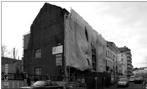
Le futur bâtiment d'Emergence - XL rue du Sceptre Het toekomstig gebouw van Emergence - XL in de Scepterstraat

Lancé sur le modèle d'une expérience française qui a démontré son efficacité (dans la ville du Havre), Emergence - XL est sur les rails. Dans le quartier Blyckaerts, en haut de la rue du Sceptre, un bâtiment communal de 1.200 m 2 (rénové avec l'aide de partenaires publics et privés ainsi qu'avec le soutien du monde associatif) accueillera un centre dédié à la formation des jeunes les moins qualifiés. On y associera la pratique du