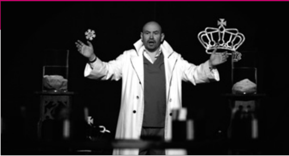
Le roi du plagiat - Théâtre Varia