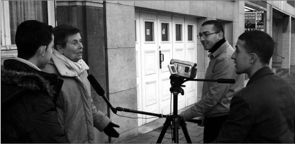
Micro-trottoir dans les rues d'Ixelles / Straatinterview in Elsene

“Onze mening wordt nooit gevraagd!” klagen jongeren vaak. Als antwoord richt Elsene een nieuwe Raad op om hun een stem te geven en om hen toe te laten concrete daden te stellen.