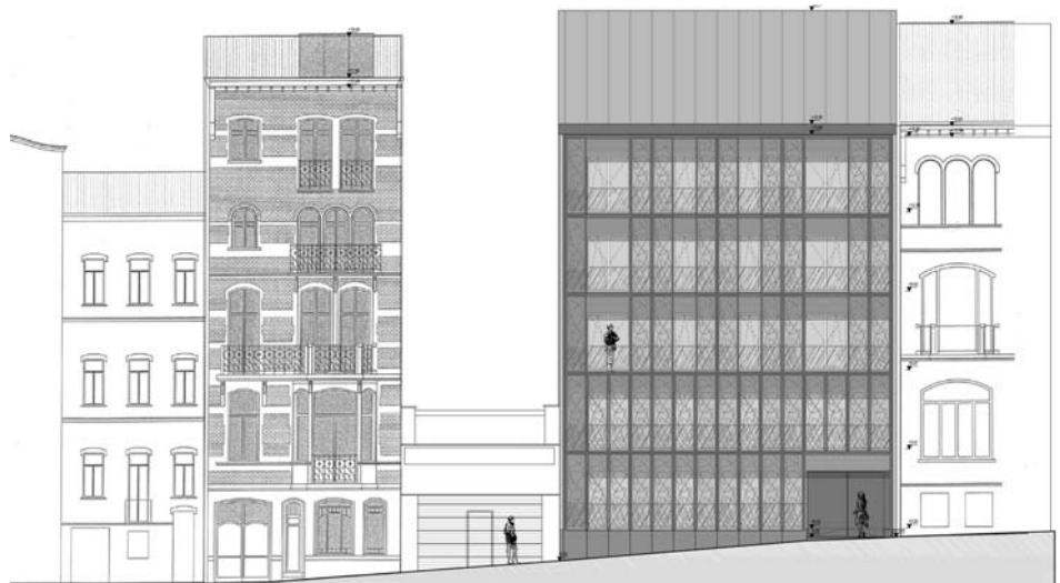
Vue de la façade avant du projet "Brasserie"