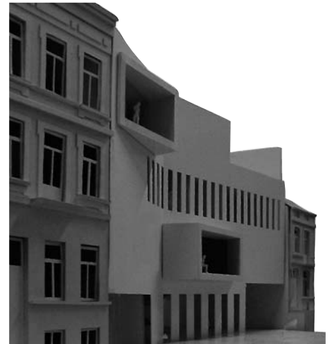
Maquette du projet “Digue-Cygnès”

Andere voorbeelden: het afvalbeheer, dat in het ontwerp van het gebouw zelf is geïntegreerd (de ruimte vergemakkelijkt het sorteren) en het optimale akoestische comfort. Het goede waterbeheer moet niet onderdoen, dankzij de waterdoorlatende gemaakte bodems en de installatie van regenwater-tanks.